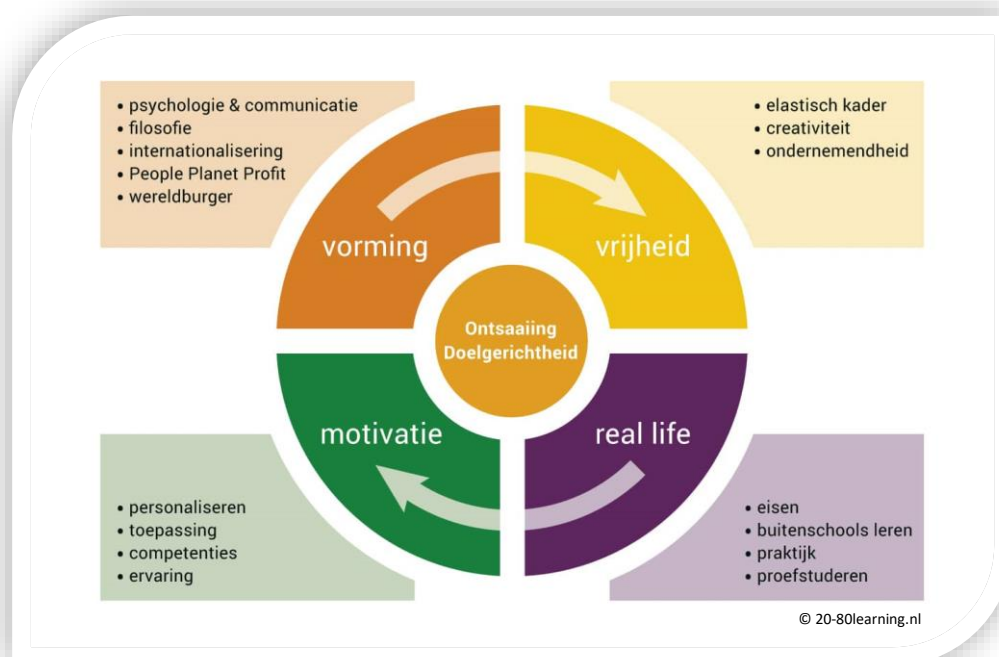
Figuur 1: Schematische weergave van de opzet van 20-80learning.

De uitdaging is om dit gedachtengoed te keren en te zoeken naar een oplossing om school weer ‘leuk’ te maken. Leny van der Ham ontwikkelde in het kader hiervan het concept 20-80learning.